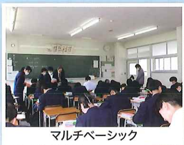
マルチベーシック