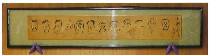
会津八一が描いた勤務していた頃の先生方の似顔絵