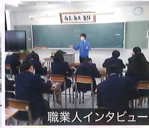
職業人インタビュー