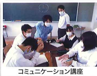
コミュニケーション講座