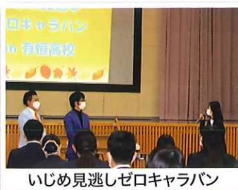
いじめ見逃しゼロキャラバン