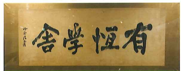
創立当時に勝海舟から贈られた扁額